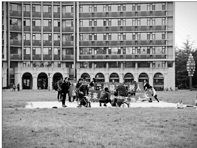
偶遇回母校的校友们，教二草坪是注定的留影点

的习惯，当冬天逐渐来临，很多同学会选择进入教室内早读，但总有零星的同学坚持在草坪上早读。或许正如马院的那位同学所说的那样，空旷的环境，更让朗读有一种发散感和纵深感。在人口密度极大的人大，草坪的空旷或许的确是一笔难得的财富。至于空气和阳光，