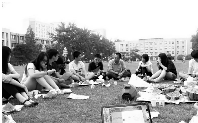
教二草坪上难忘的“西瓜会”

兴逐时来，芳草中撒履闲行，野鸟忘机时作伴；景与心会，落花下披襟兀坐，白云无语漫相留。