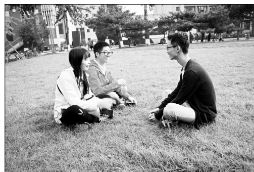
来自四川的经院2014级本科生与她的朋友，在草坪之上，夕阳附近

更是草坪的杀手锏。北京秋霜笼罩之下，草坪的存在至少能给人一种“放心”的假象。当初升的太阳攀过教一的脊背，向草坪投出它的第一眼，天地的亲和力和融为一体，就像太极的合抱一样，令人亲切安稳。而关于那位同学所说的“自