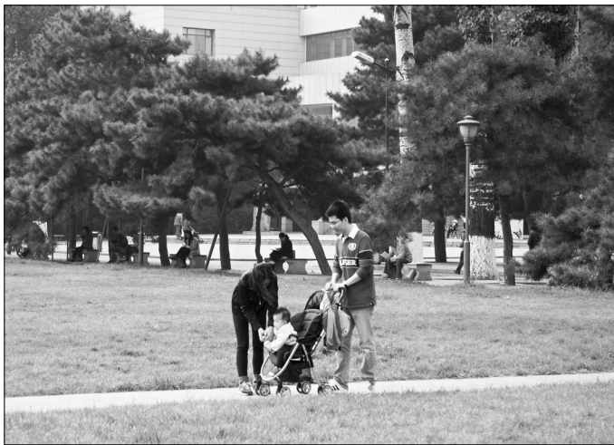
其乐融融的一家三口

22时10分。她背着沉重的书包，腋下夹着才借来的《龙虫并雕斋琐语》。求是楼灯火通明，像是夜的海洋里一艘巨轮。她也将一头扎进那亮白里，祈望那巨轮，毋宁说祈望她自己，带她去想去的地方。她看着草坪越来越空旷，想起她上大学的第一天，也看过这样空旷的草坪，那时候她在想什么呢？和她今天想的有多少不同？她摇了摇头，像是甩掉困意，又像是在笑自己的刻奇。