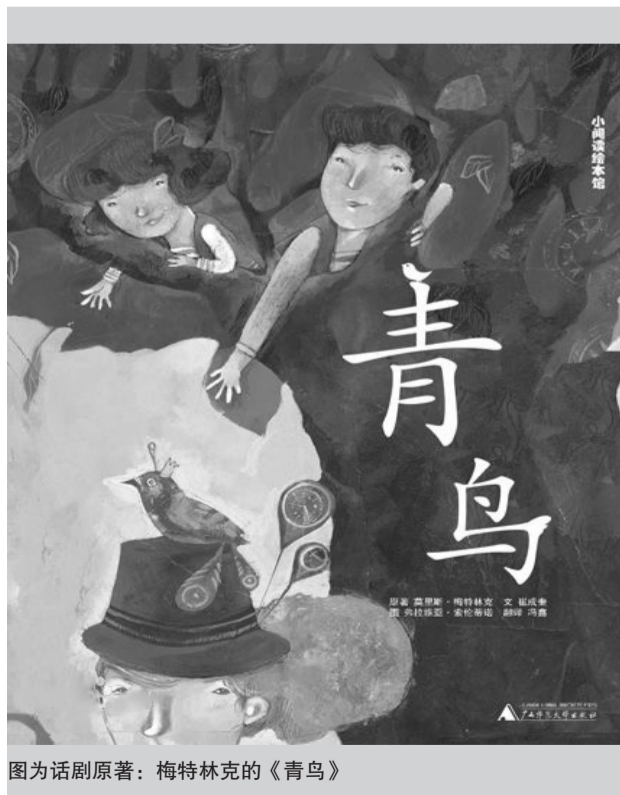
图为话剧原著：梅特林克的《青鸟》

台前幕后，不管角色大小，不管台词多少，不管职务如何，两个月里他们都在为共同的目标付出着、努力着。