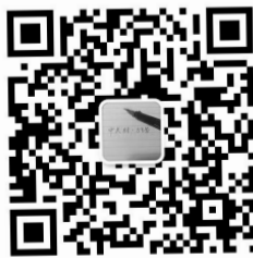
图为“中关村59”微信公众平台的二维码