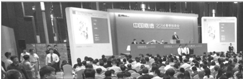
嘉德2014春季拍卖会 图 / 嘉德官网

充道。但在创业初期，由官到商的身份转变还是给甘学军带来了不小的心理落差。从前作为国家文物局的工作人员，平时的工作基本上都是按部就班，遇到困难也有专业人员的帮助。即使是到各地进行调研，行程都是被安排好的，还会受到当地文化部门的热忱欢迎。但作为民营企业家的甘学军现在却不得不面对自己从来没有接触过的工作，还需要与各地的文物商店接洽，客客气气地迁就对方的要求。但是辛苦终究换来了回报，1994年春，中国嘉德的首场拍卖便创造了1400多万元人民币的成交额，震惊全国，从此拉开了国内艺术品拍卖的帷幕。